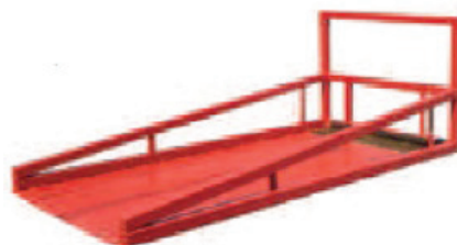
PLATAFORMA CARGA 989€