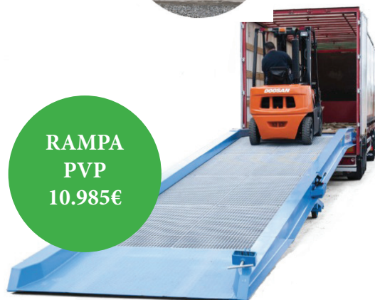
RAMPA PVP 10.985€